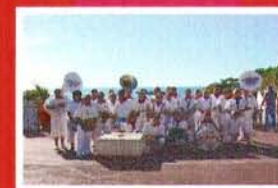
Banda LOS CLARINEROS de MIMBASTE (Landes - 40)