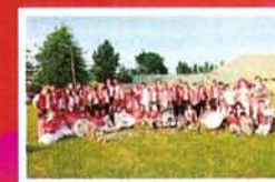
Banda LOUS TATAYOUS de LEMBEYE (Béarn - 64)