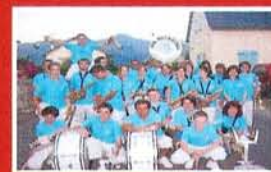
Banda LOS MUCHACHOS PIERREFITTE-NESTALAS SOULOM (Bigorre - 65)