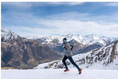
(c) Tristan Buchot Vallées de Gavarnie

Infos : 06 21 99 15 21 / grustpyreneestoy@gmail.com