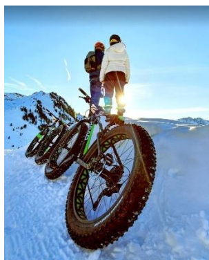
Fat Bike

AGENCE TOURISTIQUE DES VALLÉES DE GAVARNIE