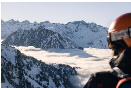
Luz Ardiden